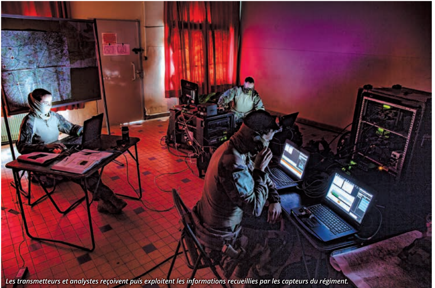
Les transmetteurs et analystes reçoivent puis exploitent les informations recueillies par les capteurs du régiment.

des entretiens avec de potentielles sources d'information. Incollables sur les enjeux culturels et sociétaux des théâtres d'opérations, ils établissent progressivement une relation de confiance lors de multiples échanges téléphoniques ou en face à face. Pour se former, ces spécialistes suivent un stage exigeant, comme l'explique le commandant d'unité de l'escadron d'instruction spécialisé : « Sur plusieurs mois, différents outils de communication