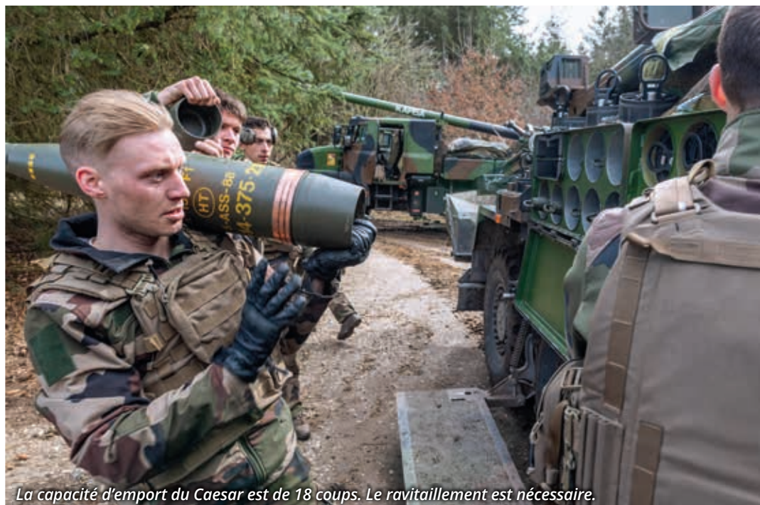
La capacité d'emport du Caesar est de 18 coups. Le ravitaillement est nécessaire.

En favorisant la collaboration et l'interopérabilité entre les forces de l'Otan et les pays partenaires, Dynamic Front contribue de manière significative à la stabilité et à la sécurité régionales, en améliorant la capacité des forces alliées à opérer ensemble efficacement en temps de crise ou de conflit. ■