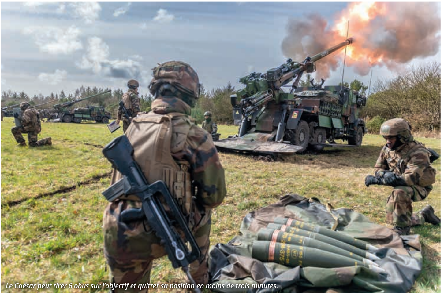
Le Caesar peut tirer 6 obus sur l'objectif et quitter sa position en moins de trois minutes.

Seuls la France, les États-Unis, le Danemark et la Pologne effectuent des manœuvres à tirs réels, pendant la phase du Live Fire Exercise .