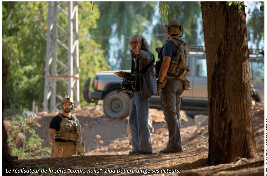
Le réalisateur de la série "Cœurs noirs", Ziad Douéri, dirige ses acteurs.

Très tôt déjà, l'armée américaine avait compris l'importance du soft power 2 en collaborant avec les studios d'Hollywood. Le jour le plus long (1962), La chute du faucon noir (2001), American sniper (2014) etc. Ces films devenus cultes dans le monde entier ont marqué plusieurs générations. Comme Israël, l'Inde ou la Corée du Sud, la France continue de renforcer son influence à travers le cinéma. « Chez nous, le patriotisme n'est pas chevillé au corps comme chez nos voisins d'outre-Atlantique. Pas à pas, nous luttons pour déconstruire les idées reçues sur nos