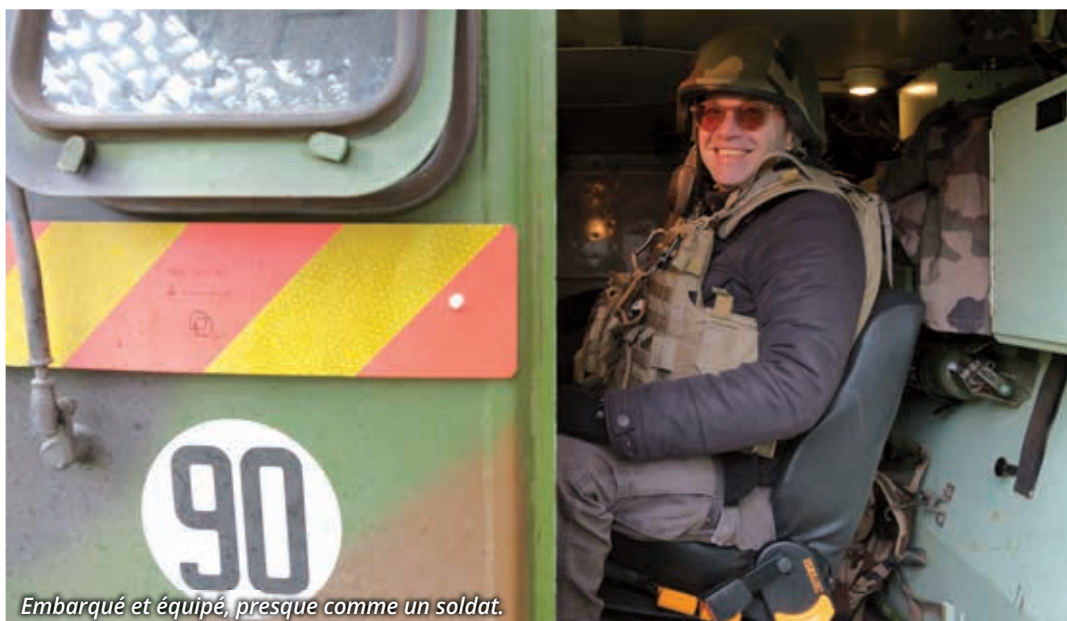
Embarqué et équipé, presque comme un soldat.