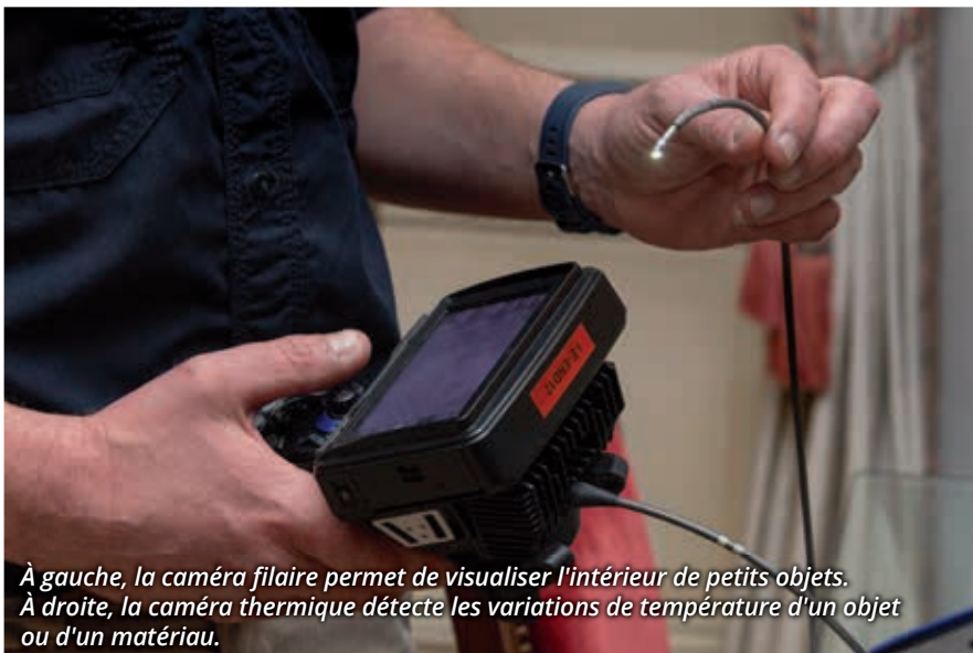
À gauche, la caméra filaire permet de visualiser l'intérieur de petits objets. À droite, la caméra thermique détecte les variations de température d'un objet ou d'un matériau.