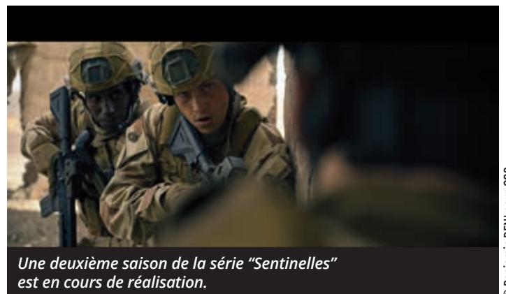
Une deuxième saison de la série "Sentinelles" est en cours de réalisation.