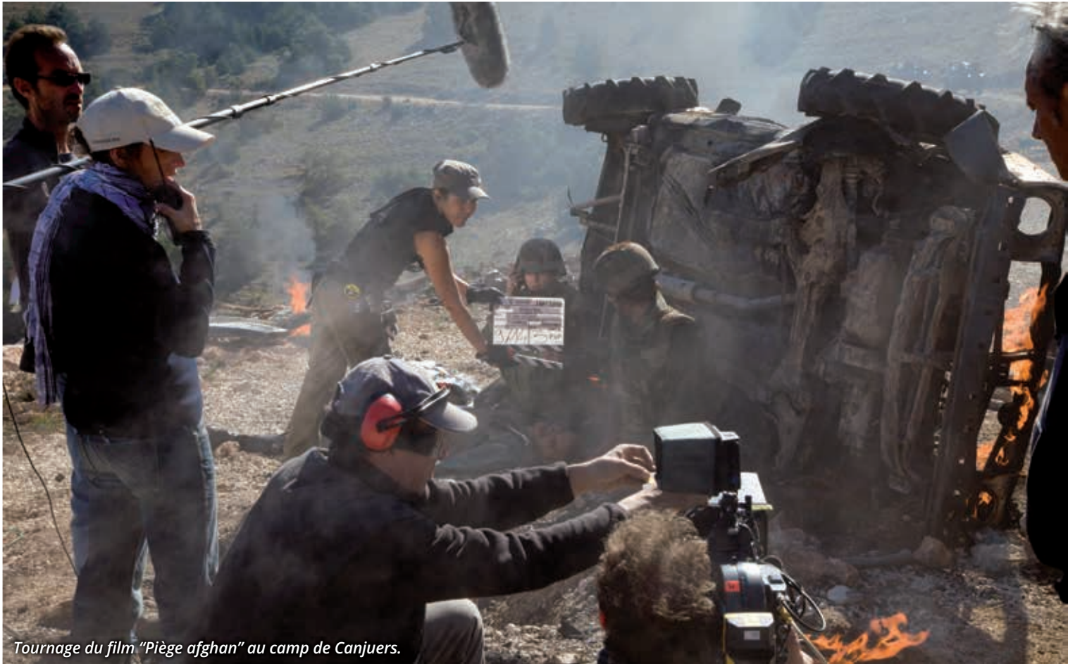
Tournage du film "Piège afghan" au camp de Canjuers.