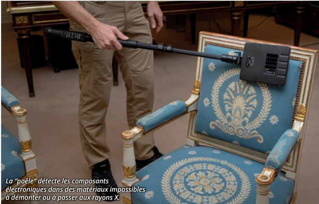
La "poêle" détecte les composants électroniques dans des matériaux impossibles à démonter ou à passer aux rayons X.

journee et s'effectue le plus souvent de nuit. Le détachement projeté est modulable en fonction du besoin. Le rôle du chef d'équipe est de prendre contact avec l'entité, généralement l'officier de sécurité, pour récolter le maximum de renseigne-