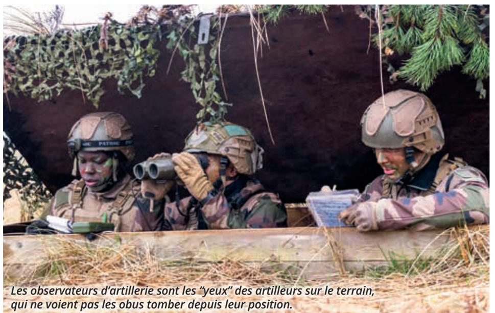
Les observateurs d'artillerie sont les "yeux" des artilleurs sur le terrain, qui ne voient pas les obus tomber depuis leur position.