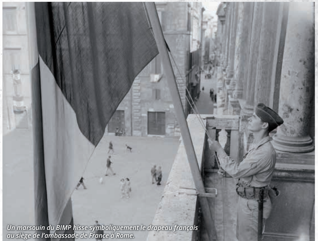
Un marsouin du BIMP hisse symboliquement le drapeau français au siège de l'ambassade de France à Rome.

Pour se familiariser avec le nouveau front du CEFI, tenu par la 4 e DMM, elles y effectuent des séjours en toute discrétion, afin de ne pas éveiller la méfiance de l'ennemi. Les résultats sont payants. Les capacités développées par le CEFI lui permettent d'attaquer en utilisant l'ensemble de ses moyens sur toute la largeur de sa zone d'action. Progressant par les hauts aussi bien que par les bas, les unités françaises submergent des forces allemandes trop habituées à un ennemi agissant de manière processionnelle le long des principaux axes. Prises de vitesse, elles ne peuvent pas se rétablir et leurs comptes rendus soulignent la redoutable capacité d'adaptation des Français. La préparation opérationnelle du CEFI représente une œuvre de longue haleine : neuf mois d'efforts soutenus ont précédé huit mois de campagne pendant lesquels elle reprend en vue de l'offensive du Garigliano. Le crédit que retire la France du succès remporté en Italie permet une participation massive de ses forces armées au débarquement de Provence et aux campa-