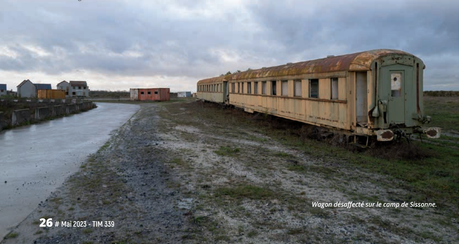
Wagon désaffecté sur le camp de Sissonne.