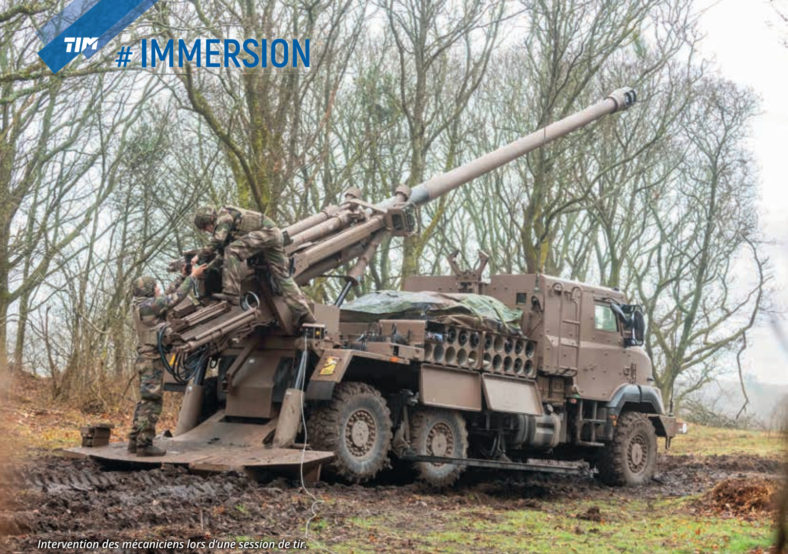
Intervention des mécaniciens lors d'une session de tir.