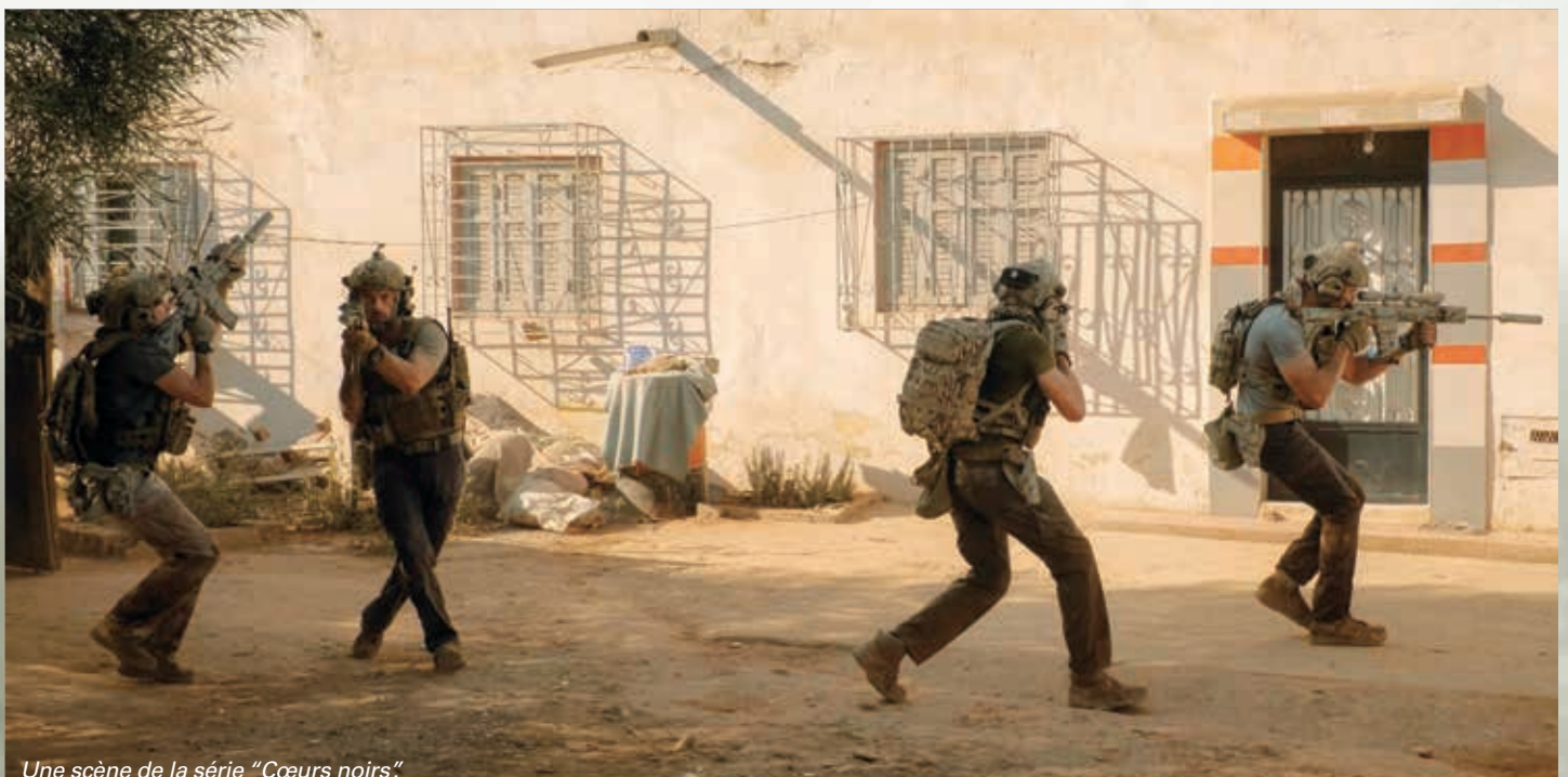
Une scène de la série "Cœurs noirs".

« Assurer aux auteurs l'accès aux réalités de l'armée de Terre. »