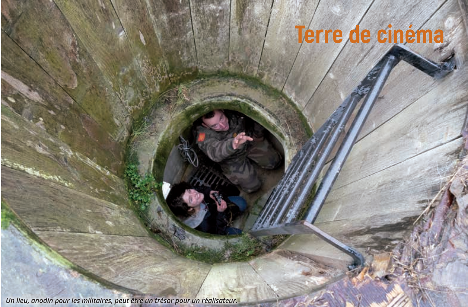
Un lieu, anodin pour les militaires, peut être un trésor pour un réalisateur.

de longue haleine alimente une base de données, qui à terme, permettra de répondre plus efficacement aux recherches spécifiques des productions. »