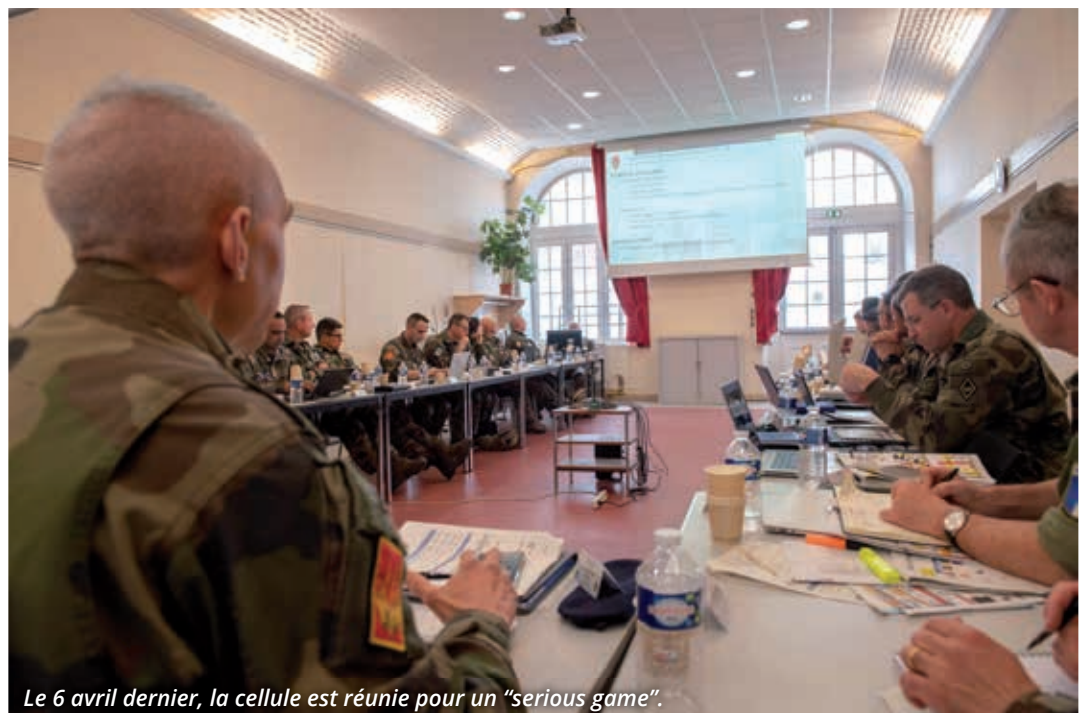
Le 6 avril dernier, la cellule est réunie pour un "serious game".

Calqué sur les directives Otan, le processus de montage des exercices est long : la préparation d'Orion aura ainsi nécessité trois ans.