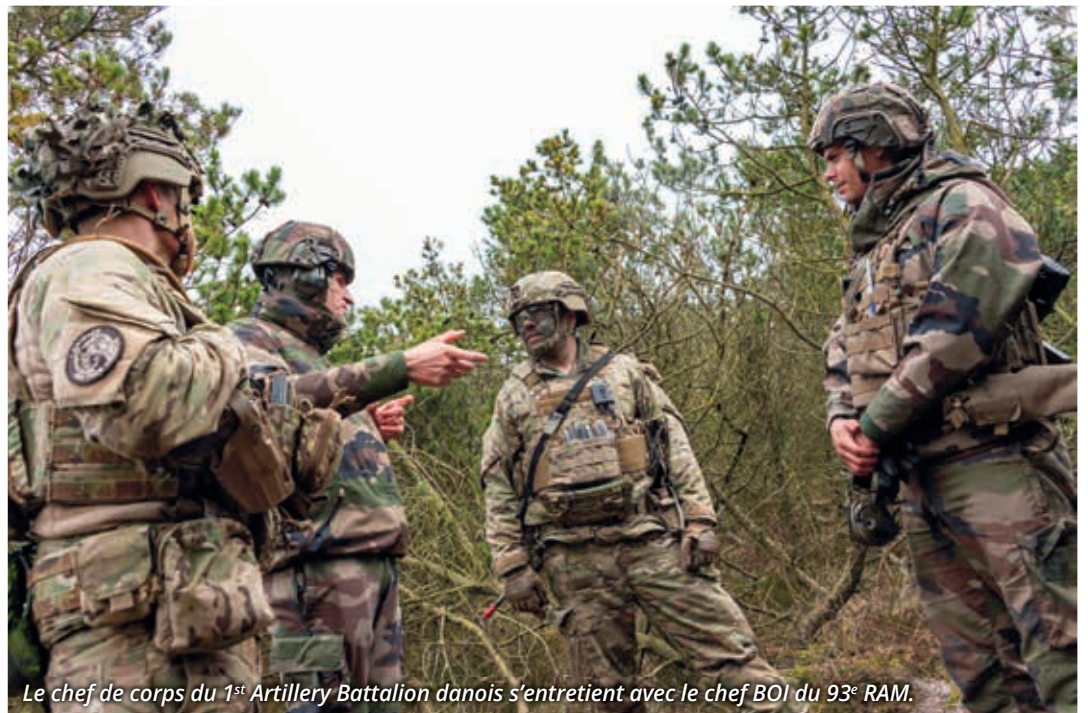
Le chef de corps du 1 st Artillery Battalion danois s'entretient avec le chef BOI du 93 e RAM.

Dans un décor aux airs de landes et de dunes écossaises, le vent est glacial, l'air humide, ce mercredi 29 mars. Creusée dans le sol, une cache en bois abrite trois soldats aux visages camouflés. Ce sont les observateurs d'artillerie du détachement liaison observation et coordination (DLOC), du 5 e régiment de dragons 4 (5 e RD). Les six soldats localisent les positions adverses