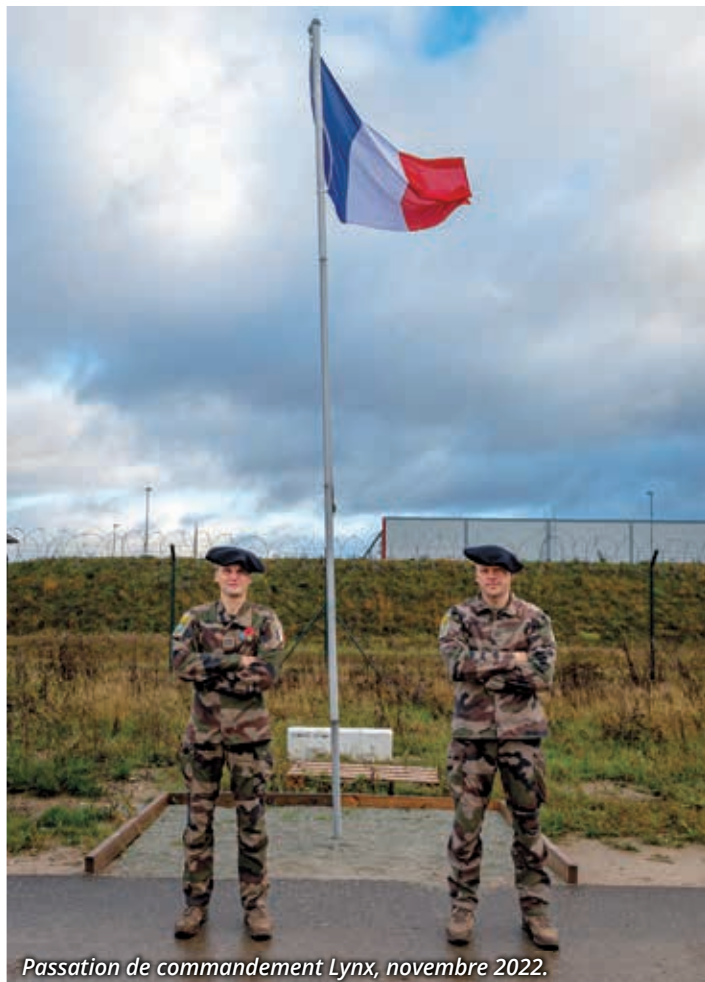
Passation de commandement Lynx, novembre 2022.

commandement britannique, ils participent à l'amélioration des process , de la conception à la conduite des opérations. Cette interopérabilité avec nos partenaires est un enjeu majeur de la mission. D'ailleurs les Français suivent une programmation répartie en trois axes. Le principal au profit de la brigade estonienne, avec des exercices de certification comme Bold Hussar ou Winter Camp . Les autres manœuvres sont organisées