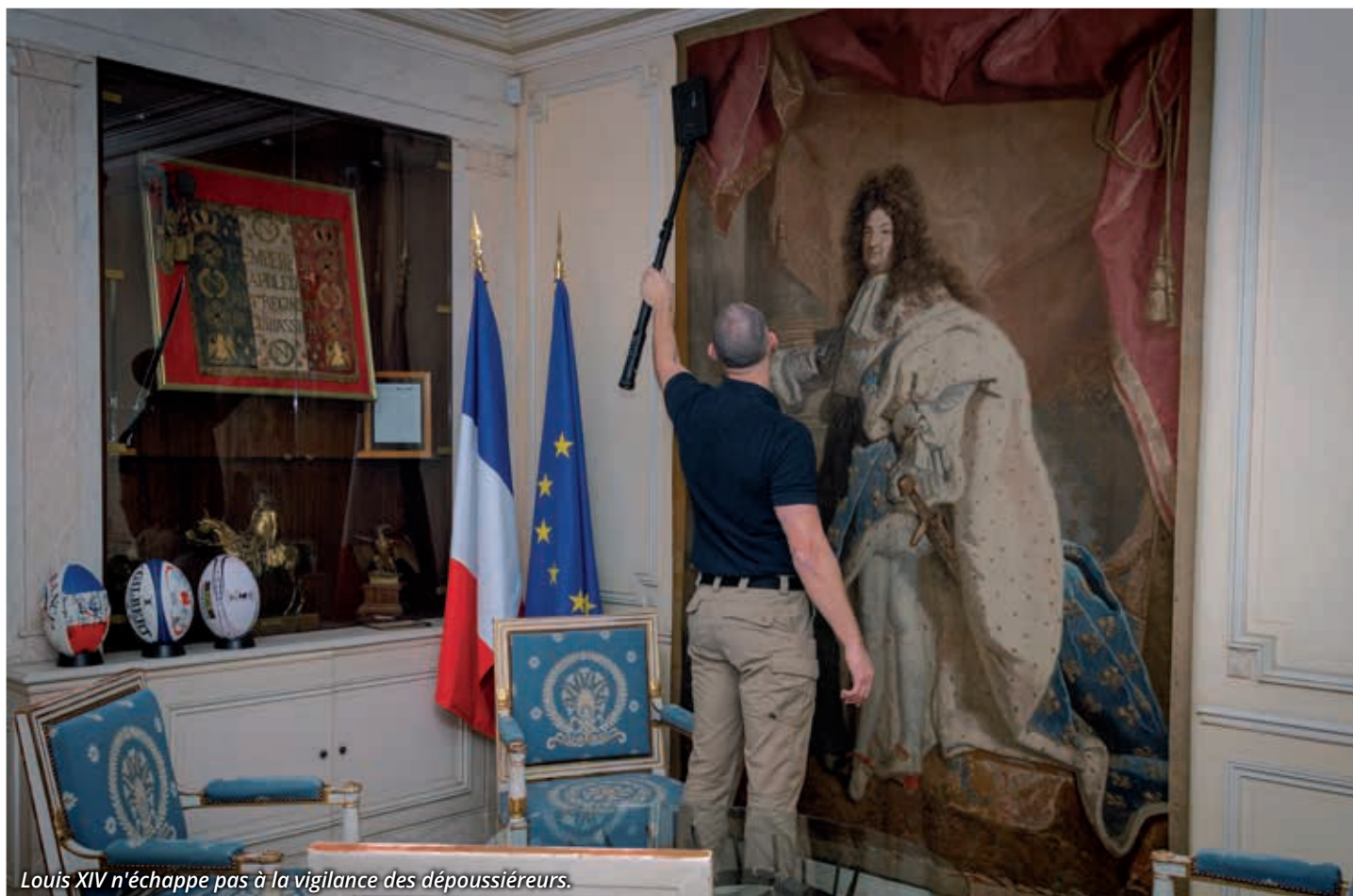
Louis XIV n'échappe pas à la vigilance des dépoussiéreurs.

Avec sa superficie et son mobilier de style Renaissance, le bureau du GMP « nécessite environ quatre heures de travail », souligne le capitaine 1 . La durée excède rarement une