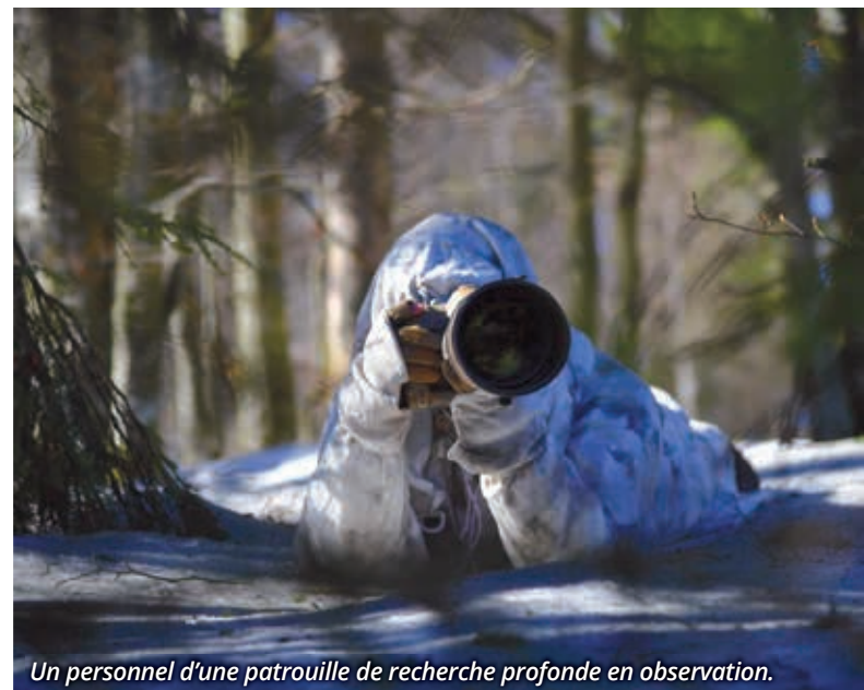
Un personnel d'une patrouille de recherche profonde en observation.