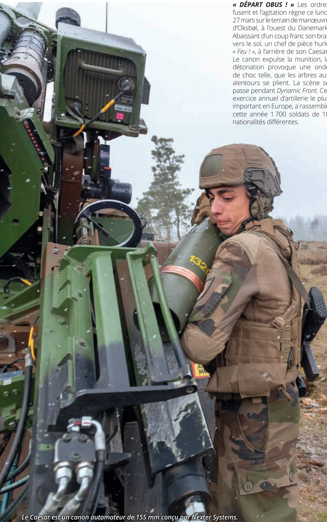
Le Caesar est un canon automoteur de 155 mm conçu par Nexter Systems.

« DÉPART OBUS ! » Les ordres fusent et l'agitation règne ce lundi 27 mars sur le terrain de manœuvre d'Oksbøl, à l'ouest du Danemark. Abaisant d'un coup franc son bras vers le sol, un chef de pièce hurle « Feu ! », à l'arrière de son Caesar. Le canon expulse la munition, la détonation provoque une onde de choc telle, que les arbres aux alentours se plient. La scène se passe pendant Dynamic Front . Cet exercice annuel d'artillerie le plus important en Europe, a rassemblé cette année 1 700 soldats de 18 nationalités différentes.