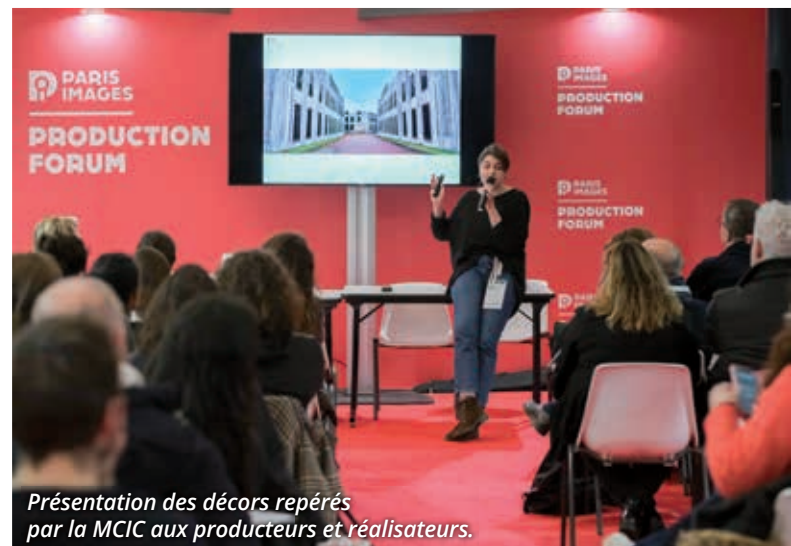
Présentation des décors repérés par la MCIC aux producteurs et réalisateurs.

L'armée de Terre compte le plus grand nombre d'emprises militaires pouvant accueillir des tournages.