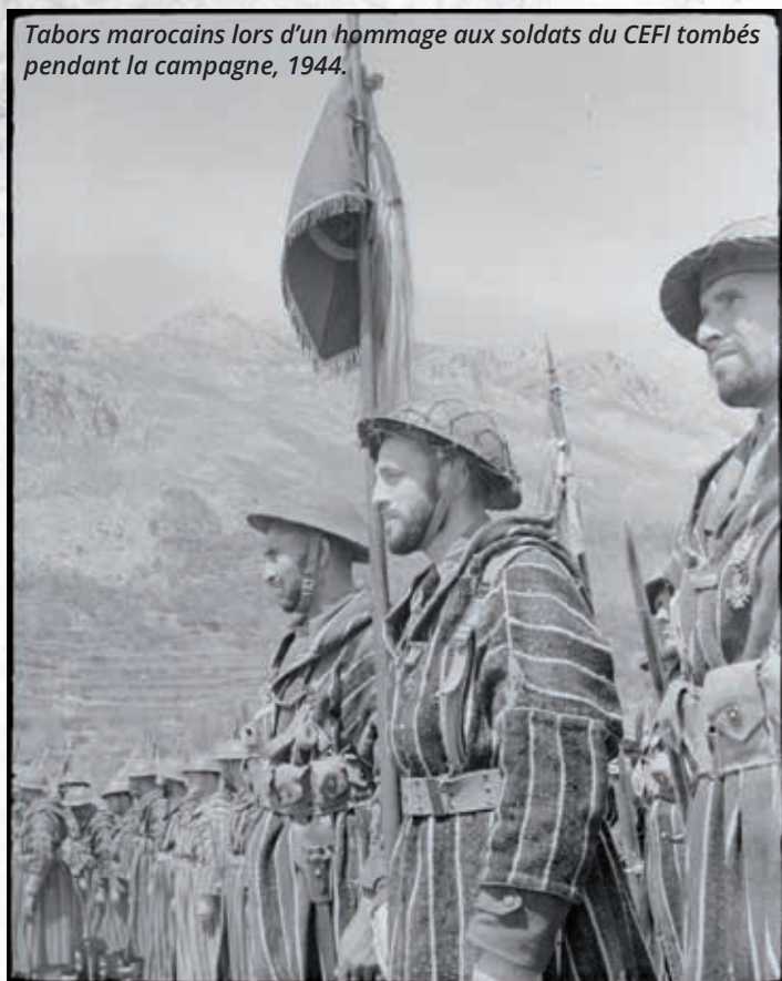
Tabors marocains lors d'un hommage aux soldats du CEFI tombés pendant la campagne, 1944.

Juin s'appuie sur les enseignements précis tirés de la campagne d'hiver pour préparer celle du printemps. Les états-majors du CEFI ont en effet été frappés par la capacité des troupes allemandes à se replier sur des positions préparées à l'avance. Ils en ont conclu qu'il était indispensable de mener des actions