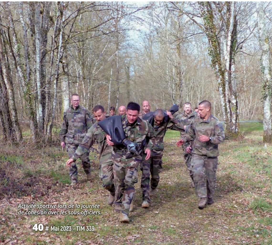
Activité sportive lors de la journée de cohésion avec les sous-officiers.