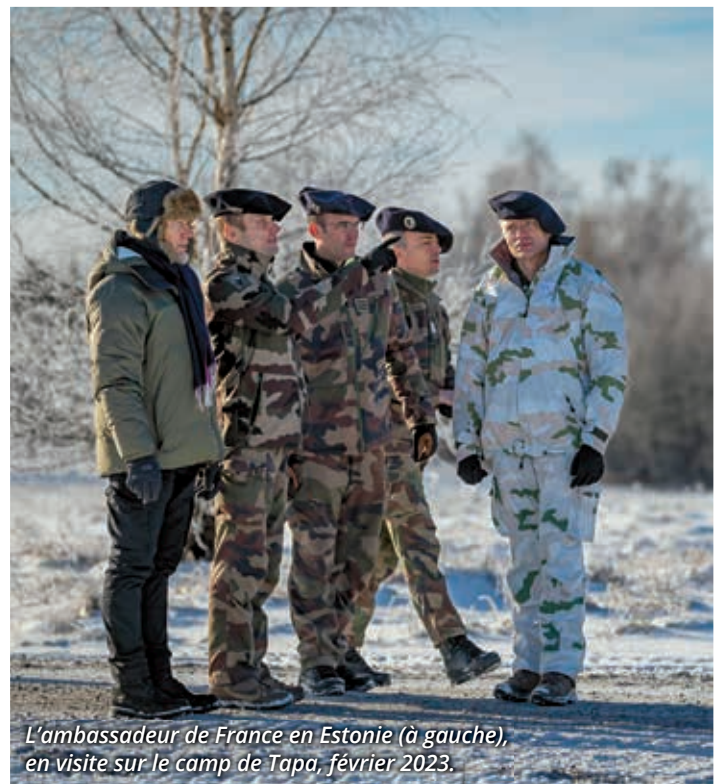
L'ambassadeur de France en Estonie (à gauche), en visite sur le camp de Tapa, février 2023.

au sein du Battle group ou à notre niveau. On a par exemple travaillé avec la Défense League , une unité de civils volontaires estoniens, sur la défense territoriale.