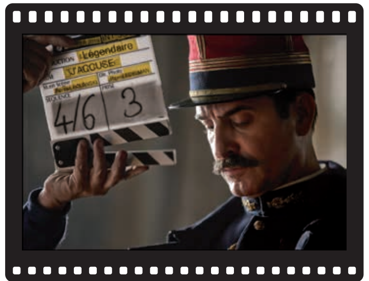
Le film "J'accuse" a été tourné en partie à l'École militaire, à Paris.

armées auprès du grand public. C'est un travail à long terme. » Côté budget, les productions américaines s'élèvent à des centaines de millions de dollars contre une dizaine pour les plus grosses productions françaises ( Le chant du loup , Notre Dame brûle... ). Pour autant, le secteur audiovisuel connaît une période charnière avec l'arrivée des plateformes de diffusion. En effet, celles-ci réinvestissent un pourcentage de leur chiffre d'affaires réalisé dans l'hexagone dans la création de films indépendants. Cette opportunité impose à l'armée de Terre de partager son univers pour séduire les Français et susciter des vocations. « D'où l'importance du succès des séries comme Sentinelles et Cœurs noirs . On montre ainsi que ces programmes répondent à une appétence du public pour nos sujets. » Action, drame, humour ou registre plus intimiste, le spectateur se divertit tout en découvrant le quotidien et l'exigence du métier de soldat. « On veut avant tout porter à l'écran des héros ordinaires. Un frère, une sœur ou un voisin engagé au service de la France, qui réalise des choses extraordinaires. » ■