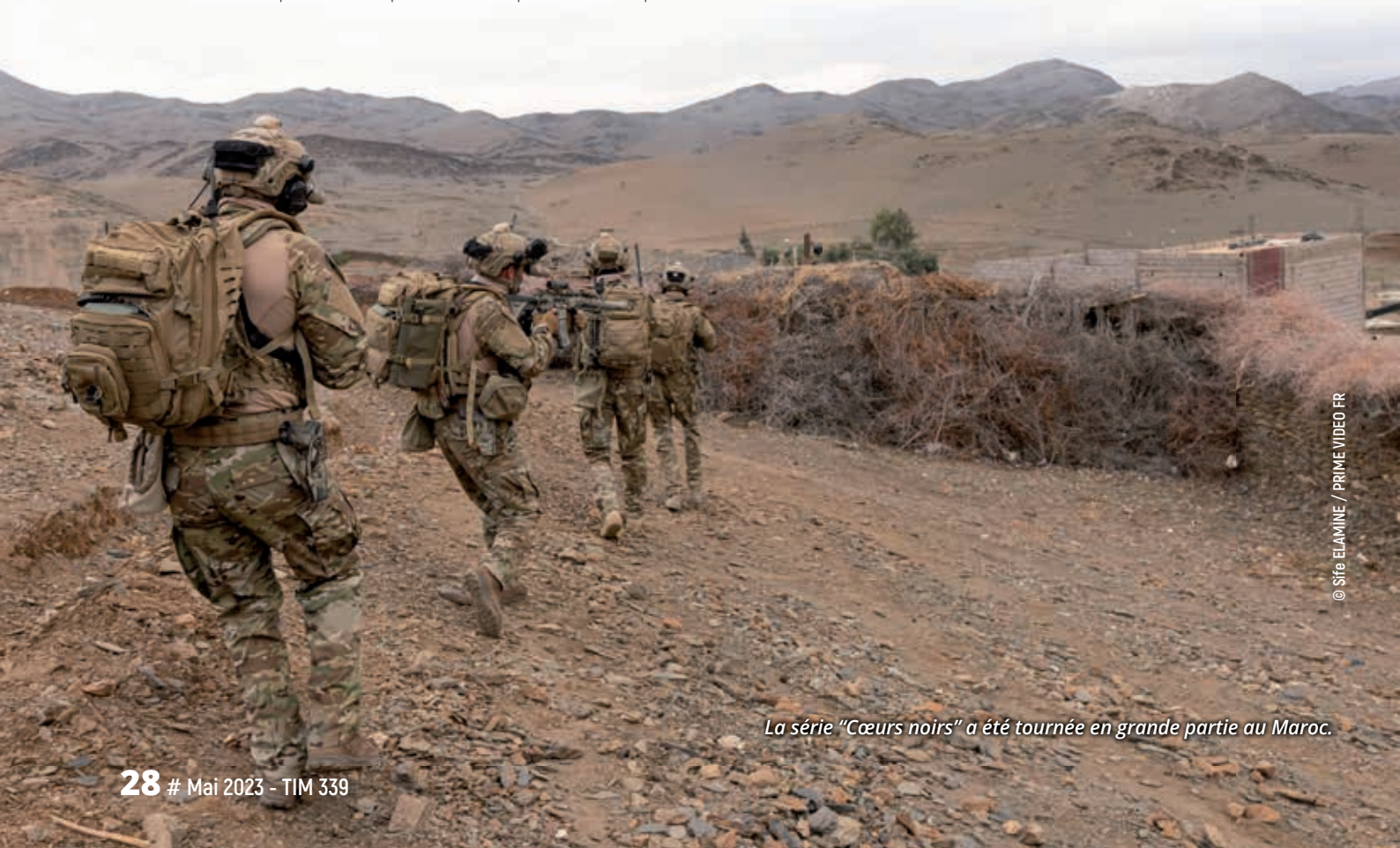
La série "Cœurs noirs" a été tournée en grande partie au Maroc.

Pour ressembler physiquement à un soldat, j'ai pratiqué du Crossfit® et de la course à pied. Durant des mois, je me suis levé tôt pour m'entraîner, travailler le mental et m'imposer une certaine rigueur