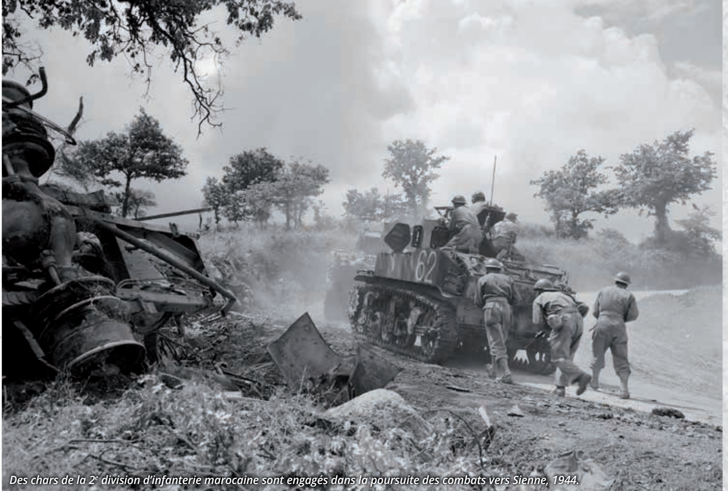
Des chars de la 2 e division d'infanterie marocaine sont engagés dans la poursuite des combats vers Sienne, 1944.